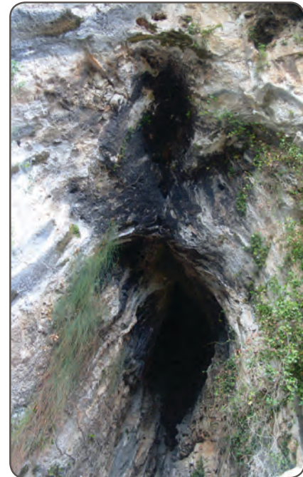
Die „Drachenhöhle“ auf der Insel Brac

Im Süden der Insel führt von Murvica aus ein teilweise ziemlich unwegsamer Pfad zu einer phänomenalen Höhle. Bereits im Altertum war sie als „ Drachenhöhle “ bekannt. Die Art der Höhlenform erinnert unübersehbar an das weibliche Geschlecht. Gerade aufgrund dieser Gestalt wird diese Höhle in der Mutterkultur als heiliger Ort und als Geburtshöhle verehrt worden sein. Nach der Christianisierung wurde sie von glagolitischen Mönchen bewohnt. Auch diese Mönche hatten sich offenbar dem allgegenwärtigen Drachenthema nicht entziehen können. Sie schufen im Eingangsbereich der Höhle ein markantes Drachenrelief, verbunden mit einer rätselhaften Darstellung der Mondin.